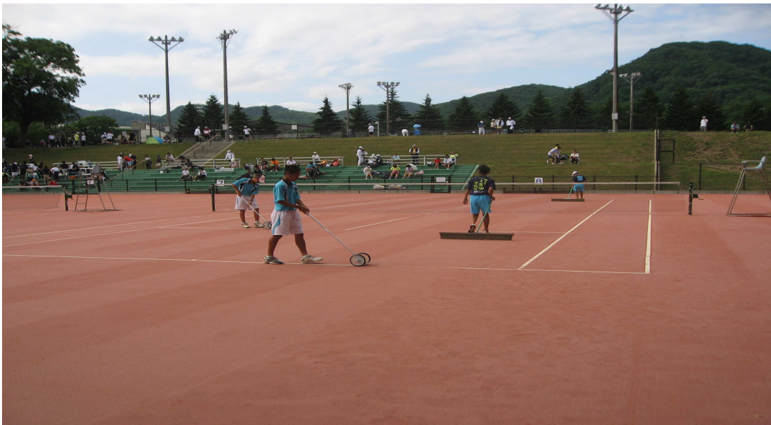
大会時のコートブラッシングとラインクリーニングの同時作業