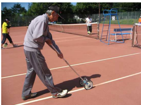
専用回転ブラシによるライン掃除