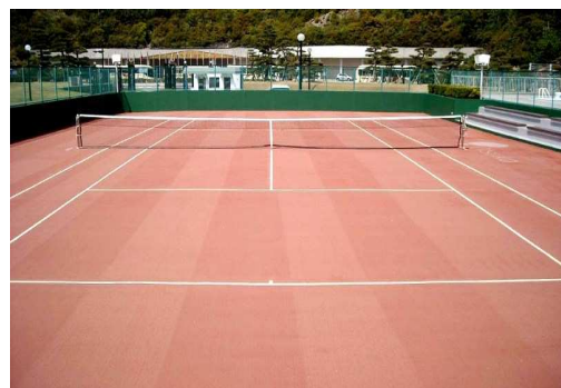
交互にブラッシングしたコート例